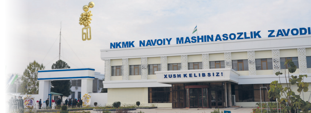
barchani bayram shodiyonalariga chorladi. Korxonada o‘yngohiga boriladigan yo‘lak bo‘ylab zavod sex va uchastkalari mahsulotlari-

O‘tgan shanba kuni zavod hududi chinakamiga bayram tusini oldi. Zavod ishchi-xizmatchilari, muhandis-texnik xodimlari, faxriylar va mehmonlar korxonada tashkil topganining 60 yilligini nishonladi. Garchand qish fasli boshlangan bo‘lsada, quyosh kun bo‘yi charaqlab turdi. Zavodga kiraverishdagi maydonda kamay-surnay sadolari yangrab,